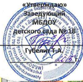
Схема плана-маршрута безопасного движения в МБДОУ детский сад №18